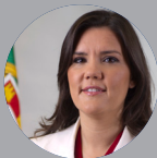
Assunção Cristas Ministra da Agricultura e do Mar